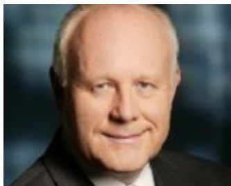
Prof. Dr. Georg Milbradt Ministerpräsident

Ich freue mich, dass die Reform im Sächsischen Landtag beschlossen wurde. Heute ist ein wichtiger Tag für Sachsen. Das weitreichende und schwierige Projekt war möglich, weil wir in Sachsen reform-