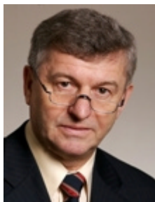
Dr. Albrecht Buttolo Sächsischer Staatsminister des Innern

Nach Verabschiedung des Verwaltungsneuordnungsgesetzes gestern ist am 23. Januar 2008 im Sächsischen Landtag eine Kreisgebietsreform zum 1. August 2008 beschlossen worden. Demnach werden die Kreise im Freistaat Sachsen neu gegliedert. Die derzeit 22 Landkreise werden auf 10, die derzeit 7 kreisfreien Städte auf 3 reduziert. Sachsen stellt sich damit auf die zukünftigen Herausforderungen durch weiteren Bevölkerungsrückgang, sinkende Zuweisungen von Bund und Europäischer Union sowie zunehmenden internationalen Wettbewerb rechtzeitig