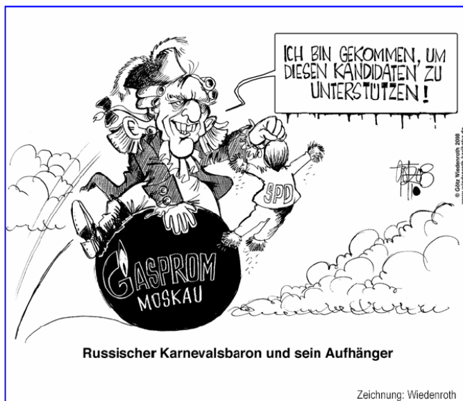
Russischer Karnevalsbaron und sein Aufhänger

70 Millionen Euro mehr ein als sie ausgaben. 2006 hatten sie noch einen Fehlbetrag von 36,96 Milliarden Euro. Von 2002 bis 2005 hatte Deutschland das Maastricht-Kriterium überschritten und 2006 erstmals seit fünf Jahren wieder die zulässige Obergrenze eingehalten.