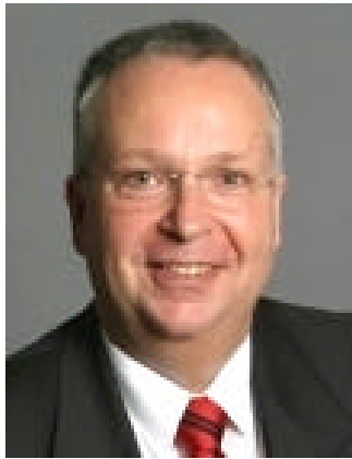
Geert Mackenroth Sächsischer Justiz- minister

Mindestens 25.000 Menschen verloren nach Schätzungen von Historikern ihr Leben - als Dresden vor 63 Jahren - vom 13. bis zum 15. Februar - bombardiert wurde. Am Mittwoch gedenken die Bürger der Stadt in vielen Veranstaltungen der Opfer und der Zerstörung.