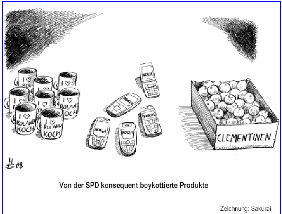
Von der SPD konsequent boykottierte Produkte