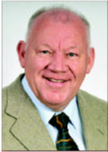
Dr. Thomas Beierlein Fraktionsvorsitzender

Im November stand die Fertigstellung und Inbetriebnahme des in neuem Glanz rekonstruierten Schloss Osterstein im besonders Blickpunkt des öffentlichen Interesses. Viele hatten an die Rettung und Wiederauferstehung des Schlosses nicht mehr geglaubt und in der Vergangenheit sogar einen Abriss der ruinösen Bausubstanz gefordert. Kein Wunder, wenn man sich selbst an die Bilder des Verfalls zurück erinnert. Einer kleineren Gruppe von Visionären ist es vor einigen Jahren jedoch gelungen, die Hoffnung in die Zukunft des Schlosses am Leben zu erhalten und gemeinsam mit dem Stadtrat den Plan zu dessen Rettung zu ver-