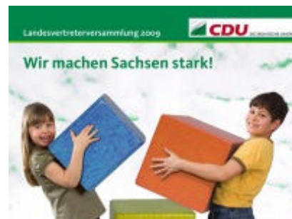
"Wir machen Sachsen stark!" - Plakat auf der Landesvertreterversammlung