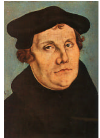
Dr. M. Luther Der Reformator