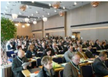
Engagiert für Sachsen - Landesvertreterversammlung