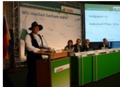
Heimat in Sachsen - Die Sächsische Union bleibt die Sachsenpartei