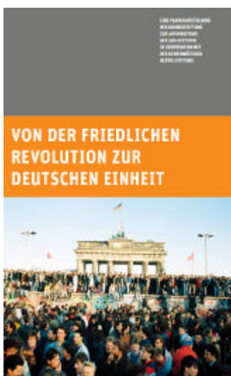
Eine zeitgeschichtliche Ausstellung in 20 Plakaten

Vom 15. bis 21 April in den Zwickau Arcaden zu sehen