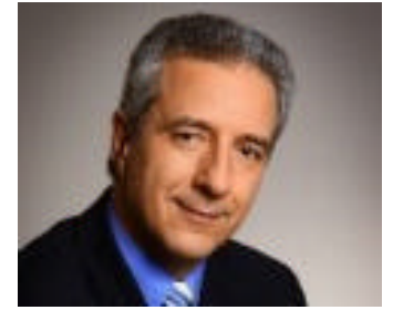
Stanislaw Tillich Ministerpräsident

sierung des Vier-Meere-Korridors noch mehr Nachdruck zu verleihen, komme es jetzt entscheidend auch auf das nationale Handeln des Bundes an: Die Bundesregierung müsse nun rasch auch auf der Schienenstrecke Dresden-Prag aktiv werden. Tillich: "Der Vier-Meere-Schienenkorridor wird von der Kommission nur dann als Bestandteil des zukünftigen europäischen Verkehrsnetzes anerkannt werden, wenn die Schienenstrecken auch im Bundesverkehrswegeplan verankert sind. Gegenwärtig überprüft das Bundesverkehrsministerium Änderungen am Bundesverkehrswegeplan aufgrund von zwischenzeitlich eingetretenen Wirtschafts- und Verkehrsentwicklungen. Sachsen erwartet, dass der Bund im Ergebnis dieser Überprüfung die Neubaustrecke Dresden-Prag in den Bundesverkehrswegeplan einordnen wird", so der sächsische Ministerpräsident.