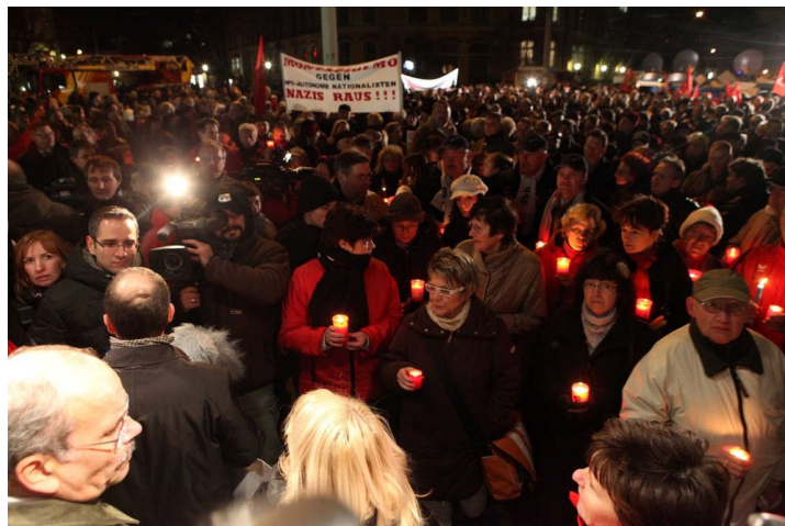
Zahlreiche Bürgerinnen und Bürger folgten dem Aufruf