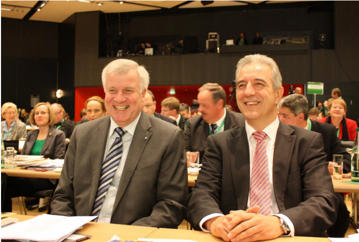
Stanislaw Tillich (r.) und Gastredner Horst Seehofer (l.) auf dem Landeparteitag in Plauen

Stanislaw Tillich ist erneut zum Landesvorsitzenden der Sächsischen Union gewählt worden. Mit 89,57 Prozent gaben ihm die 238 Delegierten des 26. Landesparteitages in Plauen den Auftrag, die Sächsische Union in den kommenden zwei Jahren weiter zu führen.